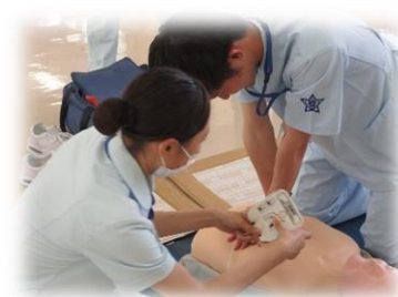
19回生(2年生)の看護技術演習の様子です